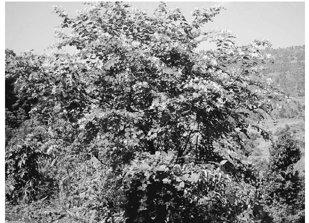
पशुपालनको लागि उपयुक्त डाले घाँस टाँकी