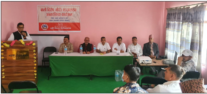
बाली विशेष (मौरी) का संजालहरूसँग अन्तरक्रिया गोष्ठी