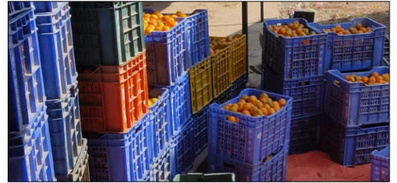
सुन्तला ब्लक सञ्चालक समिति माडी गा.पा.६ रोल्पाको सुन्तला बजारिकरणका दृष्यः