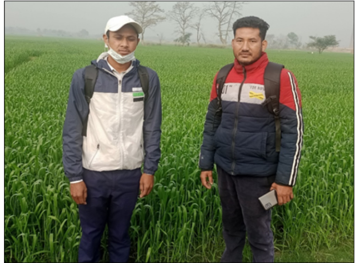
गहुँ विजवृद्धि:- बिजय जात रामग्राम-१४, नवलपरासी