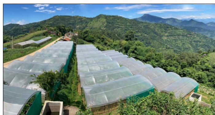
स्मार्ट कृषि गाउँ कार्यक्रम, छत्रकोट-१, हुँगा