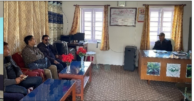
राष्ट्रिय सुन्तलाजात फलफूल अनुसन्धान कार्यक्रम धनकुञ्जा कार्यालय प्रमुखद्वारा विकास गरिएका जात र प्रविधिबारे प्रस्तुती