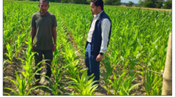
छत्रकोट गाउँपालिका वडा नं १ गुल्मीमा अकबरे खुसानीमा बीउ उत्पादन कार्यक्रम