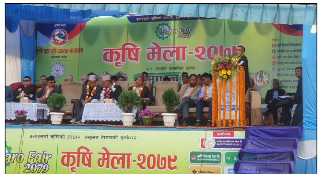
कृषि मेला २०७९, बुटवल