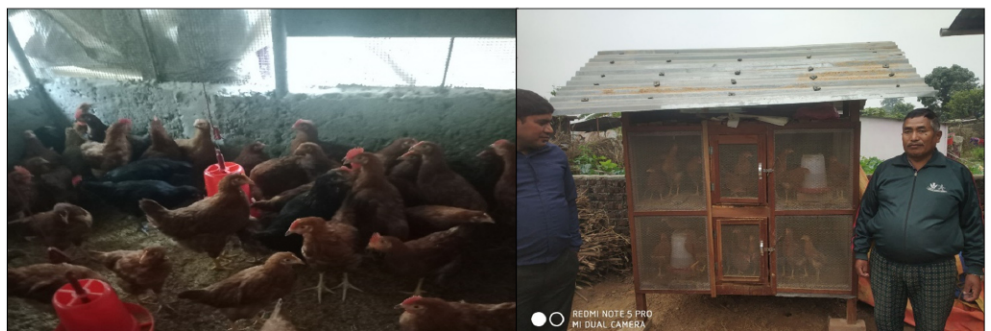
पोषण सुधारका लागि ग्रामिण कुखुरा पालन कार्यक्रम, सैनामैना न.पा.-०१

प्रदेशका सबै जिल्लाहरूका विपन्न तथा उत्पिडित समुदायका गरिव कृषकहरूलाई लक्षित गरी प्रति समुह रु ५ लाख बजेट परिधि भित्र रही कृषकहरूको पोषण सुधारमा टेवा पुर्याउने उद्देश्यले जिल्ला स्थित भेटेरीनरी अस्पताल तथा पशु सेवा विज्ञ केन्द्र र एकिकृत कृषि तथा पशुपन्छी विकास कार्यालय मार्फत एउटा जिल्लामा कम्तिमा २ वटा समुहहरूमा यो कार्यक्रम संचालन गरिएको छ।