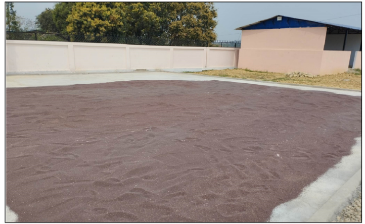
बढैयाताल नगरपालिका वडा नं. ०६, बर्दियामा तोरी प्रवर्द्धन कार्यक्रम