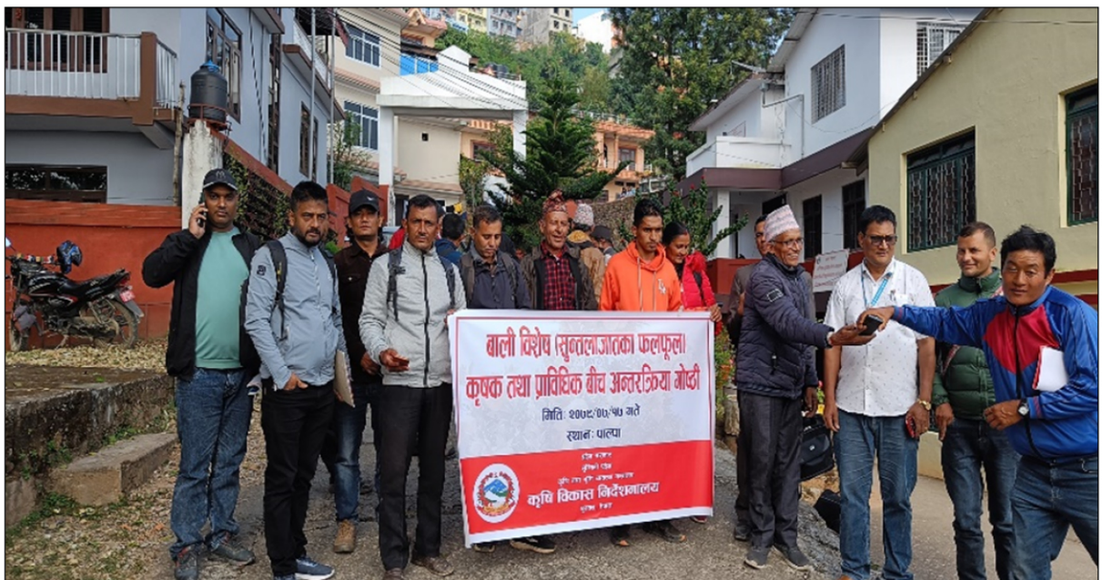
बाली विशेष (सुन्तलाजातका फलफूल) कृषक तथा प्राविधिक वीच अन्तरक्रिया गोष्ठी

प्राप्त विवरण अनुसार लुम्बिनी प्रदेशमा हालसम्म विभिन्न फलफूल वाली विशेष ९३ वटा दर्ता भएका फलफूल विरुवा उत्पादन नर्सरीहरु रहेका र जिल्ला र प्रदेश स्तरमा फलफूल नर्सरीहरुको संजाल गठन नभएको हुँदा छरिएर रहेका नर्सरी फर्महरुलाई संगठित गरी फलफूल नर्सरीहरुलाई स्थान र फलफूल बाली विशेष