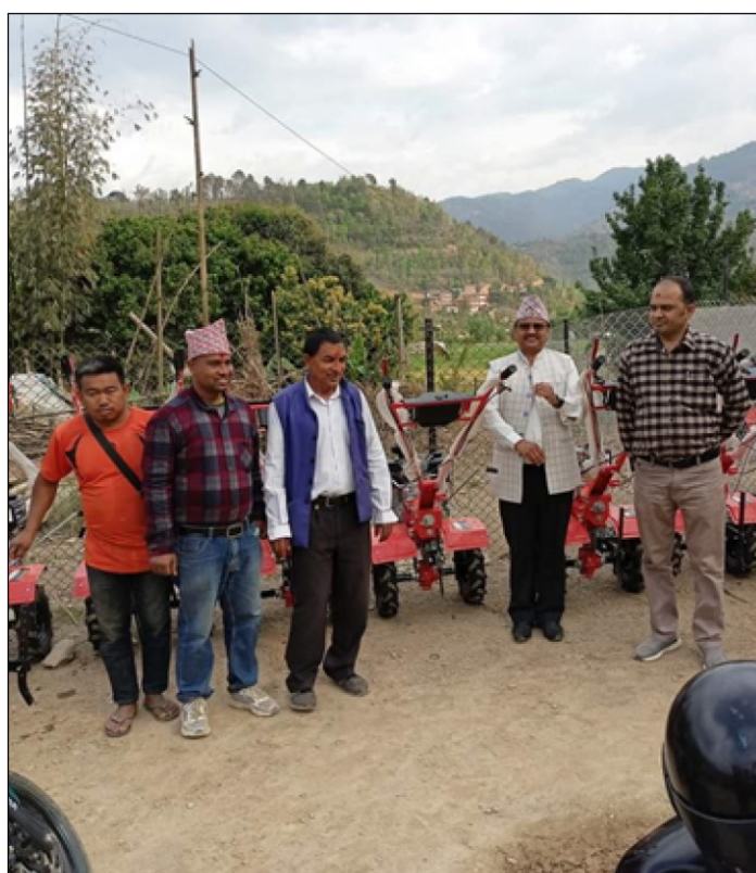
सन्धिखर्क स्मार्ट कृषि गाँउ कार्यक्रम अन्तर्गत यान्त्रीकरण वितरण कार्यक्रम