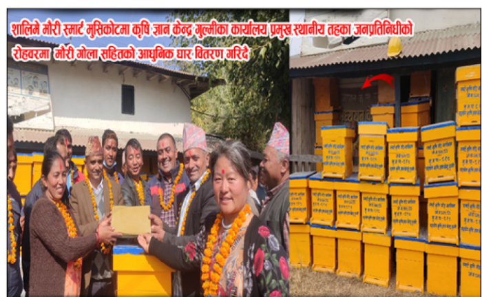
शालिने गौरी स्मार्ट नुसिकोटमा कृषि ज्ञान केन्द्र अल्लुका कार्यालय, प्रमुख स्थानीय तहका जनप्रतिनिधीको रोहवरमा गौरी गोला सहितको आधुनिक धार वितरण गरिँदै