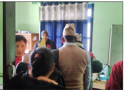
एकीकृत कृषि तथा पशुपन्छी विकास कार्यालय, बर्दियामा सञ्चालन गरिएको कृषक सहयोगी कक्ष