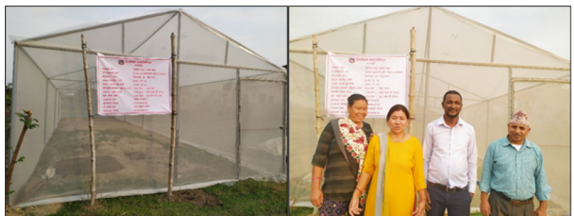
मागमा आधारित कृषि विकास कार्यक्रम, तिलोत्तमा-४, डिङ्गरनगर, शिक्षित नमूना कृषक समूह

जिल्ला स्थित कृषि तथा पशुपन्छी हेर्ने कार्यालयहरु मार्फत जिल्लाभर संचालनमा रहेका मागमा आधारित कृषि विकास कार्यक्रममा चालु आ.व. २०७९/८० मा प्रदेशका सबै जिल्लामा गरी ७ करोड भन्दा धेरै बजेट विनियोजन गरी बढीमा प्रति कृषक १ लाखमा नबढने गरी धेरै भन्दा धेरै कृषकहरुले आफ्नो फर्म वा खेतबारीमा भएको समस्यालाई समाधान गर्नको लागि विभिन्न बाली बस्तुमा तथा पशुपन्छी तर्फ गोठ सुधार वा सुदृढिकरण लगायतको काम सम्पन्न गरिएको छ । जसमा प्रविधी र पुर्वाधारको क्षेत्रमा सहयोग उपलब्ध भएको छ । उत्पादन र वजारको सम्भावना भएका विभिन्न वालिहरु तरकारी, कुरीलो, अदुवा बेसार, लसुन प्याज जस्ता अन्य बालीहरु समेतको प्रवर्द्धन गरी आत्मनिर्भरता तर्फ लैजाने हेतुले वालि वस्तुको छनौट गरिएको छ ।