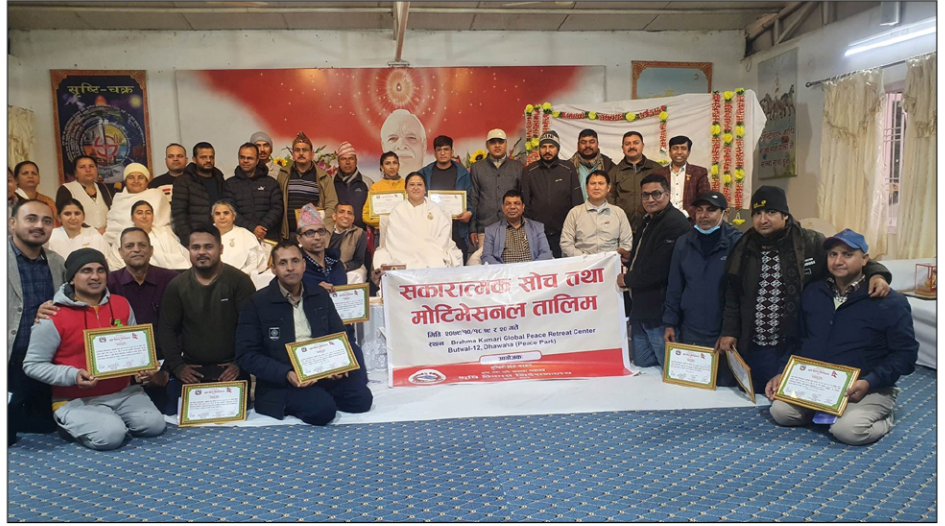
सकारात्मक सोच तथा मोटिभेशनल तालिम

कृषि तथा भूमि व्यवस्था मन्त्रालयका साथै प्रदेश कोष तथा लेखा नियन्त्रकको कार्यालय र ओमशान्ती समाजका समेत सो तालिममा सहभागी भएका थिए। उक्त तालिममा शैद्धान्तिक तथा व्यावहारिक कक्षाका माध्यम बाट सहभागीलाई प्रशिक्षित गराईएको थियो भने तालिम समापन पश्चात सम्पूर्ण सहभागीलाई फ्रेम गरेको प्रमाणपत्र वितरण गरिएको थियो। आयोजक