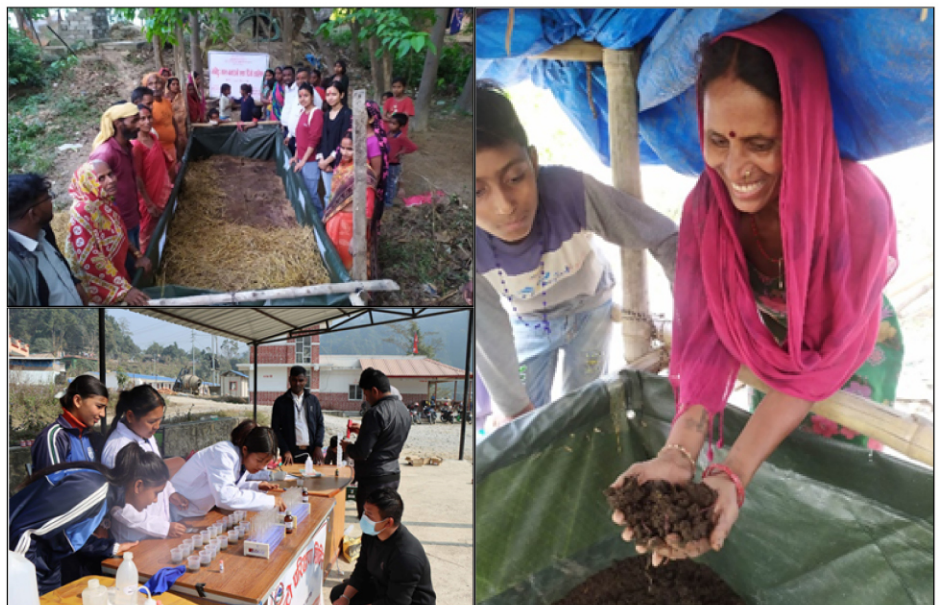
माटो परिक्षण शिविर कार्यक्रम तिनाउ गा.पा. ३, पाल्पा

तरकारी खेती हुने यस क्षेत्रमा माटोको अवस्थाबारे जानकारी लिन र माटोको व्यवस्थापन गर्न २०३ वटा माटोको नमुना संकलन गरी माटोमा रहेको प्राञ्चारिक पदार्थ, PH, Nitrogen, Phosphorous, Potassium को जाँच गरियो । अधिकांश माटोको नमुनामा प्राञ्चारिक पदार्थ र Nitrogen, Phosphorous, Potassium कम रहेको पाईयो भने माटो pH अम्लिय रहेको पाईयो । सोही नतिजा अनुरूप माटोको अवस्था सुधारको लागि आवश्यक तालिमहरू सञ्चालन गरी १० वटा भर्मिभेडमा गड्यौला मल बनाउने कार्य भैरहेको छ । त्यसैगरी पशुको गोबर र मुत्रको सदुपयोग गर्ने उद्देश्यले २० वटा भकारो सुधारको कार्यक्रम पनि सञ्चालनमा रहेको